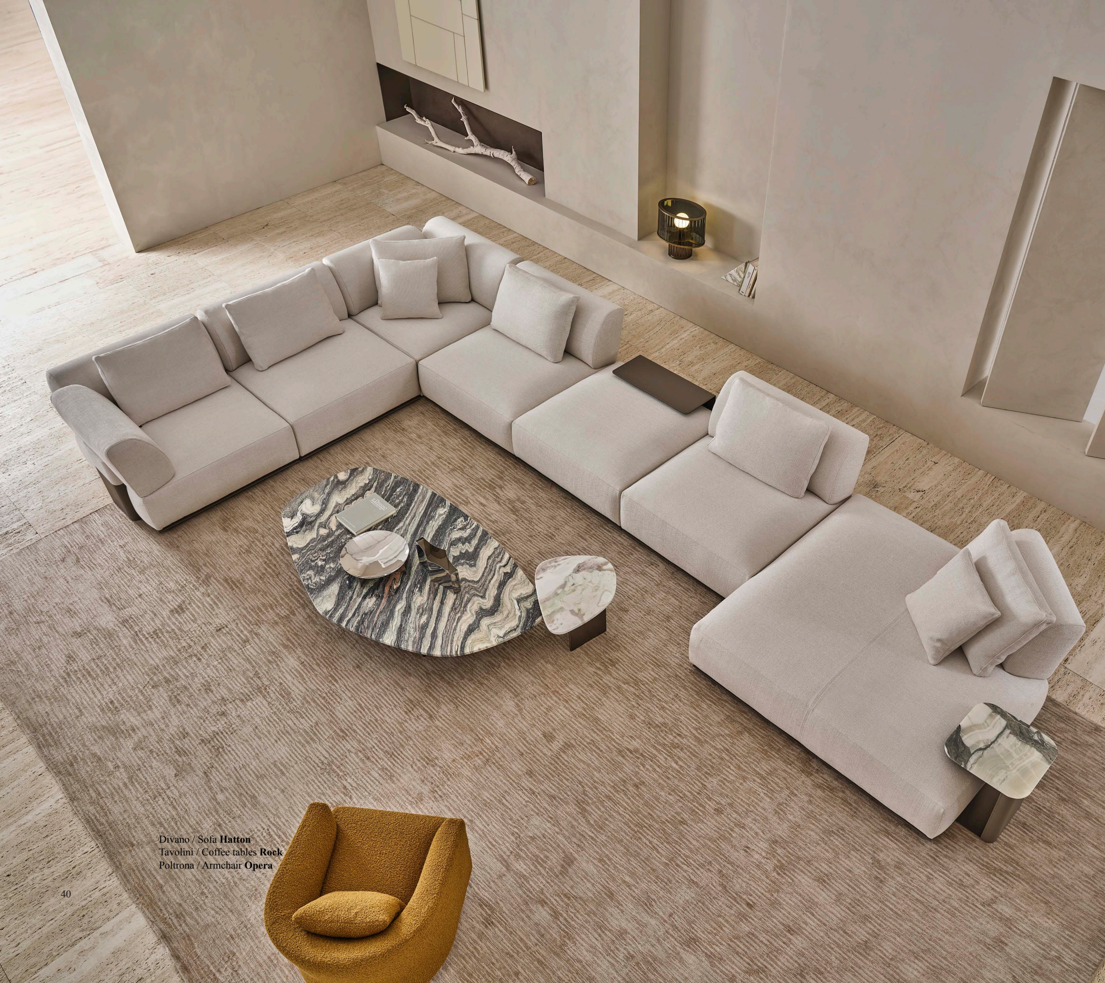
Divano / Sofa Hatton Tavolini / Coffee tables Rock Poltrona / Armchair Opera