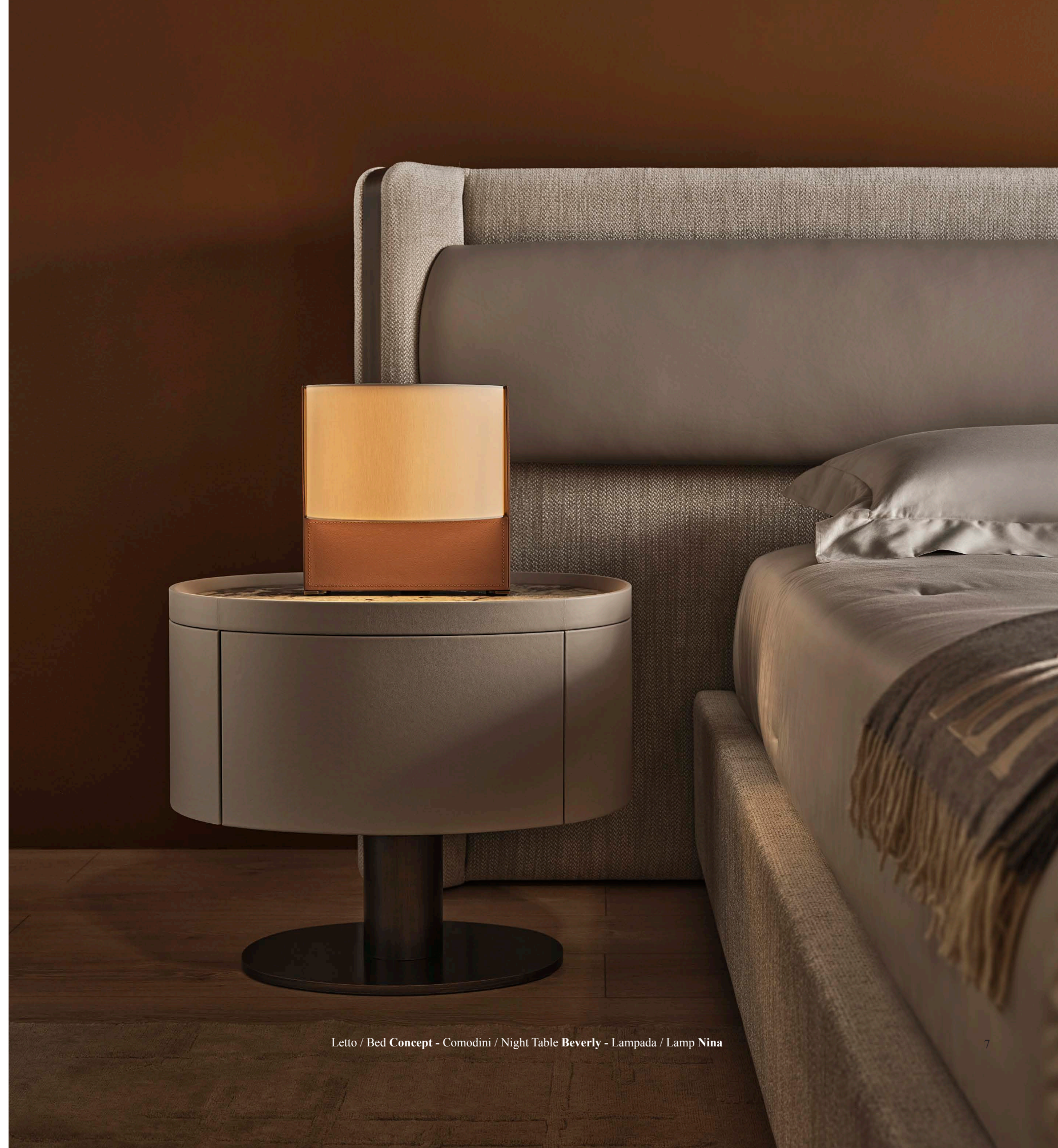
Letto / Bed Concept - Comodini / Night Table Beverly - Lampada / Lamp Nina