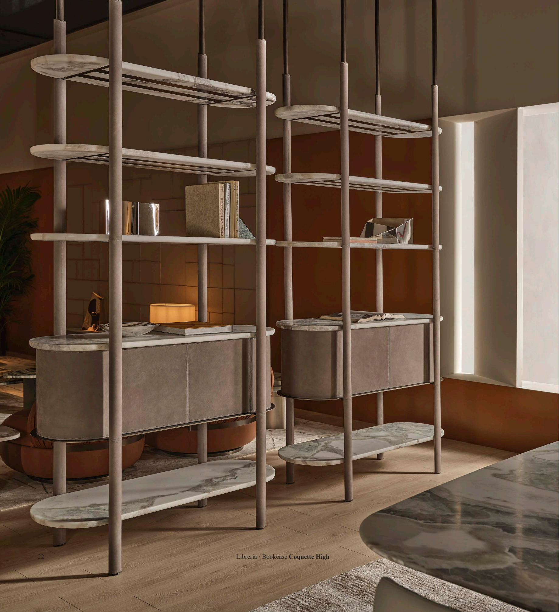
Libreria / Bookcase Coquette High