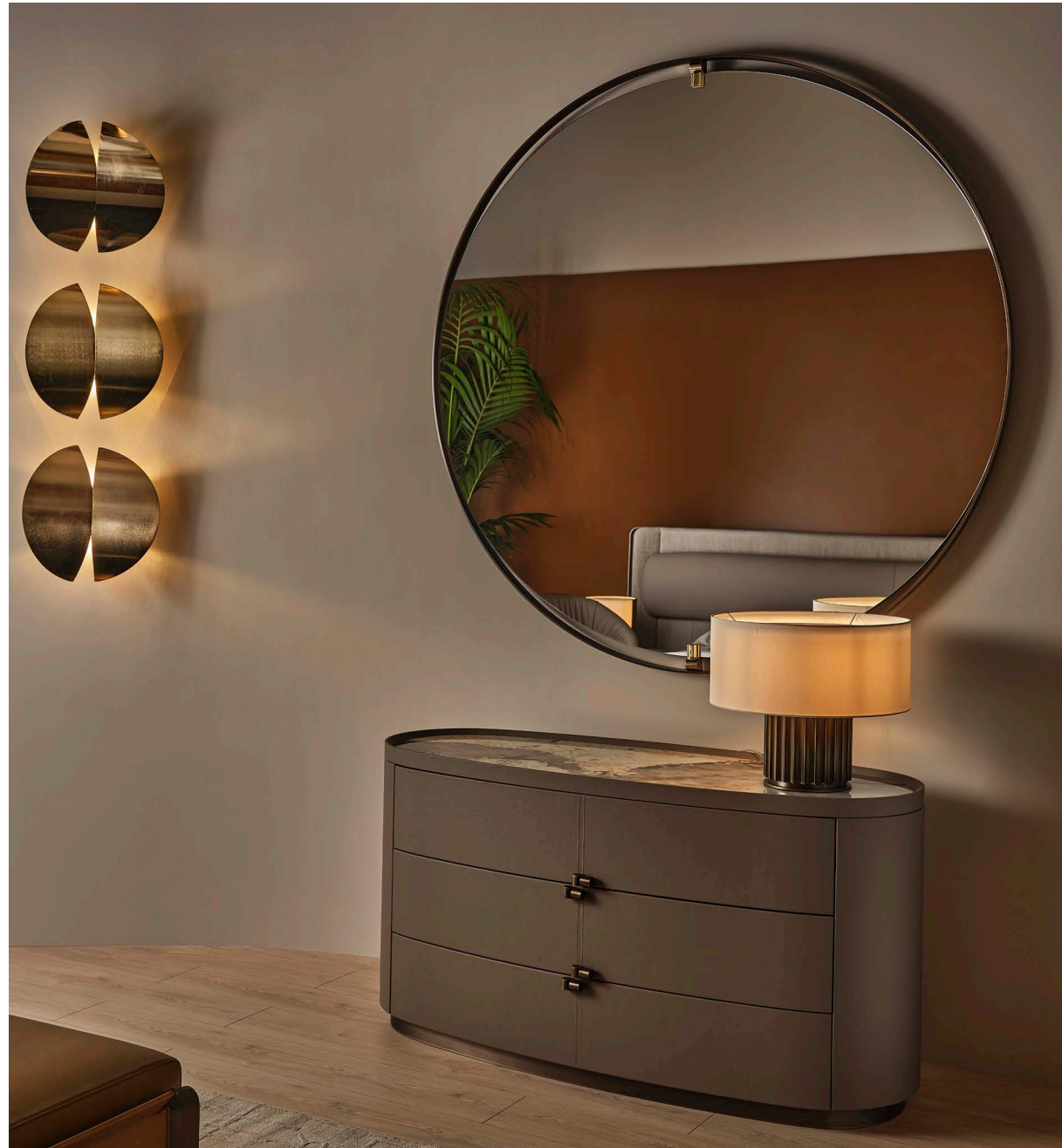
Comò / Chest of drawers Boheme Lampada / Lamp Liberty Soft Specchio / Mirror Ofelia Applique/ Wall Lamp Duo