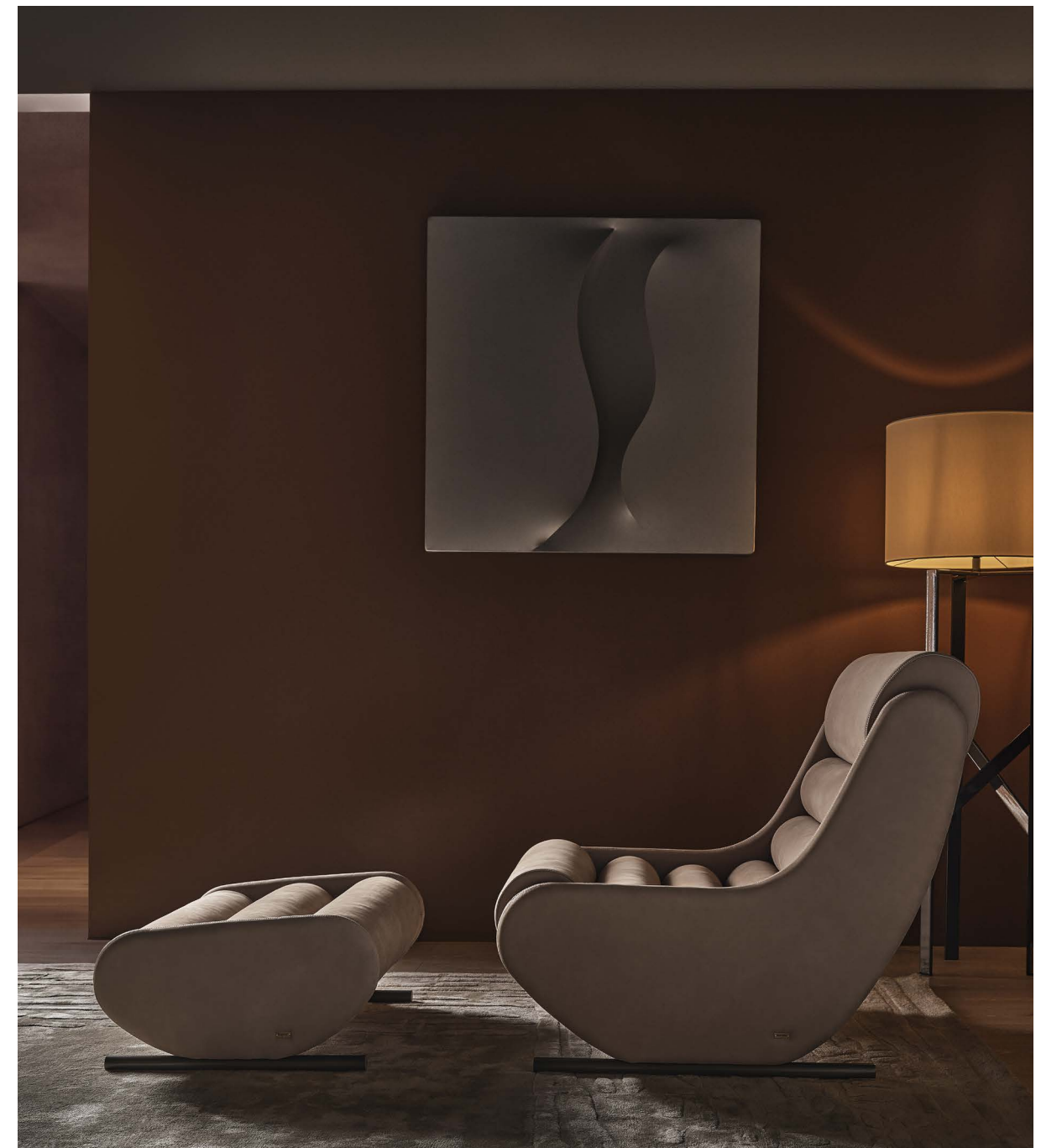
Poltrona / Armchair Eloise