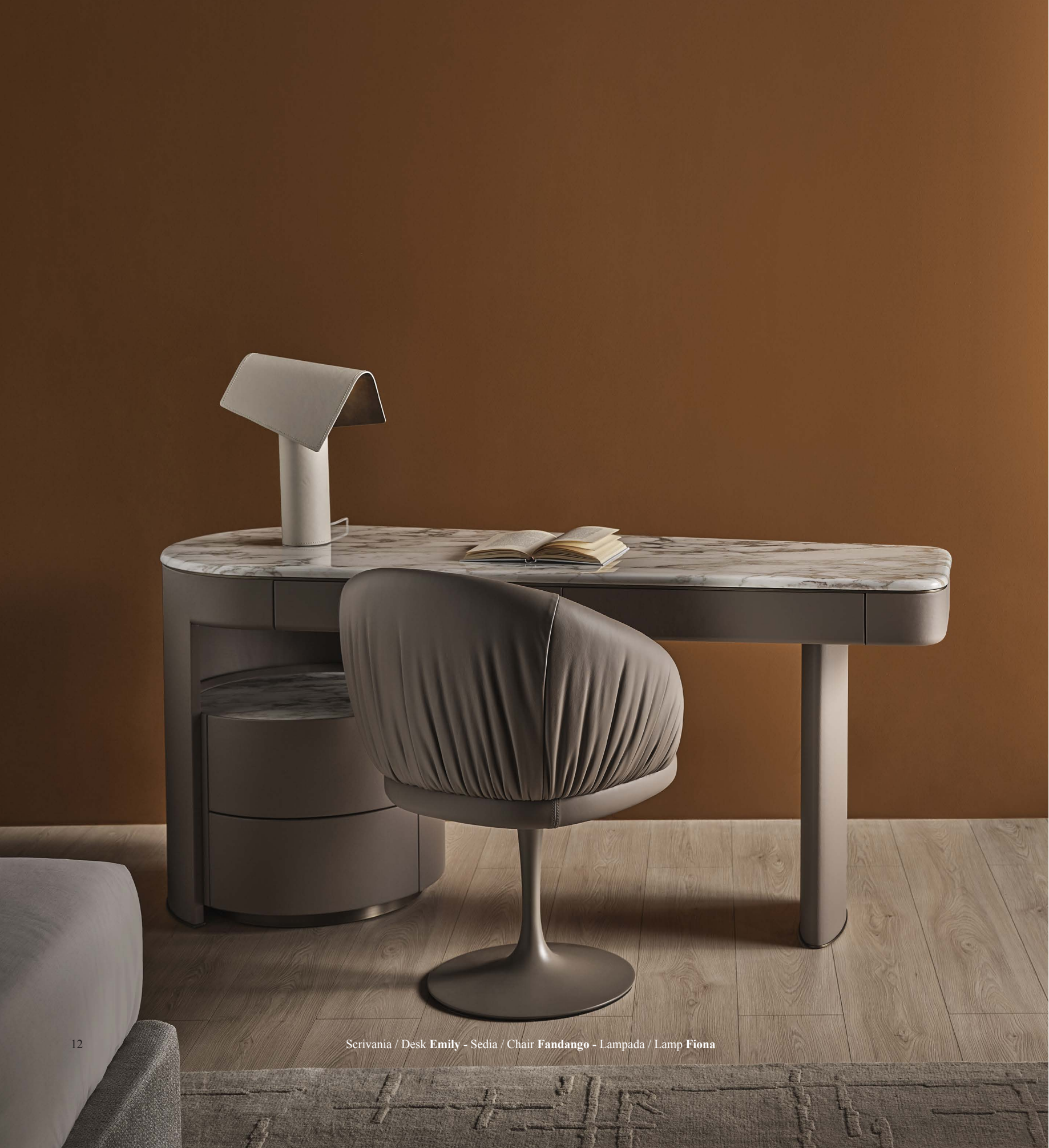
Scrivania / Desk Emily - Sedia / Chair Fandango - Lampada / Lamp Fiona