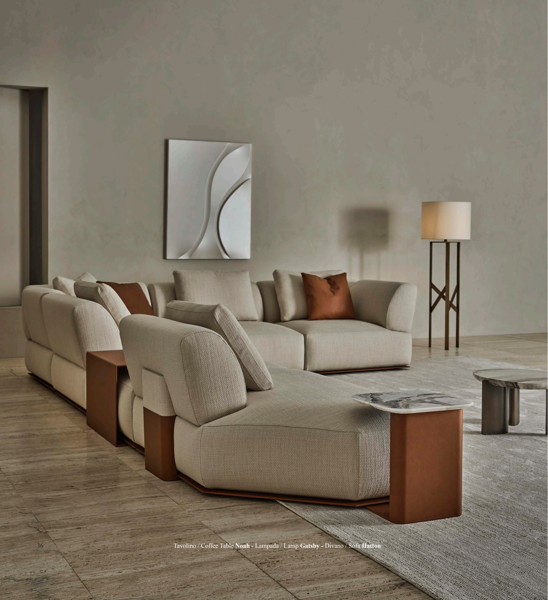
Tavolino / Coffee Table Noah - Lampada / Lamp Gatsby - Divano / Sofa Hatton