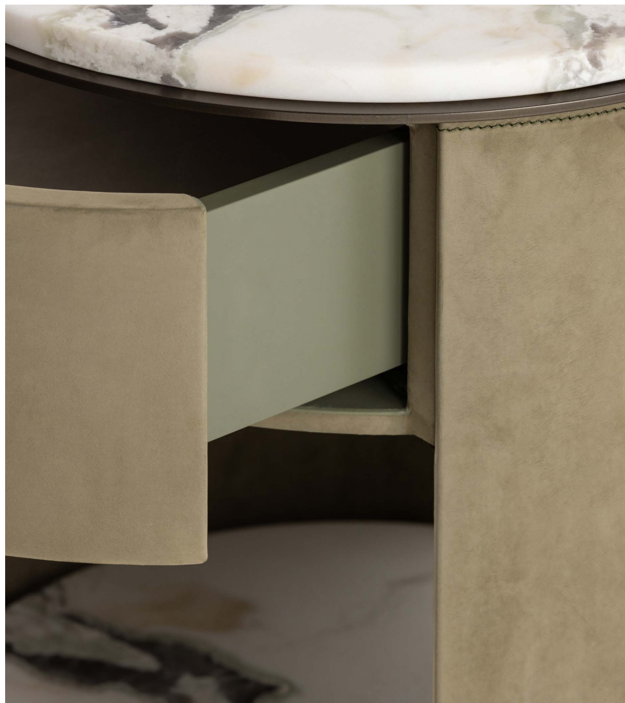
Letto / Bed Anais Comodini / Night Table Floyd Lampada / Lamp Wanda