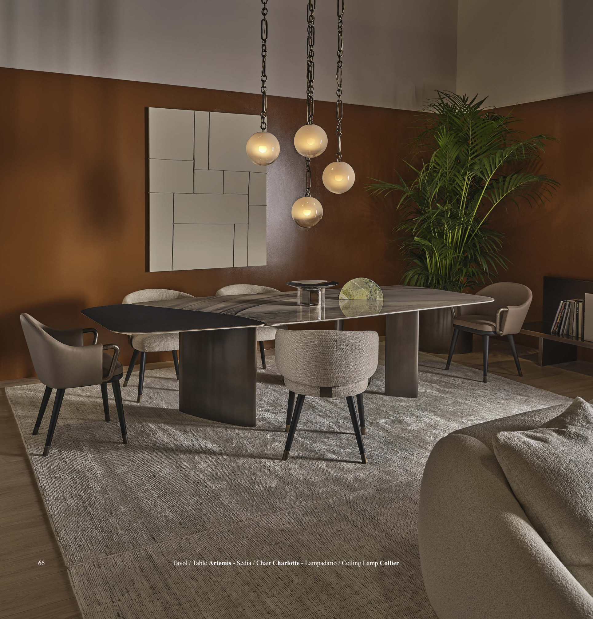
Tavolo / Table Artemis - Sedia / Chair Charlotte - Lampadario / Ceiling Lamp Collier