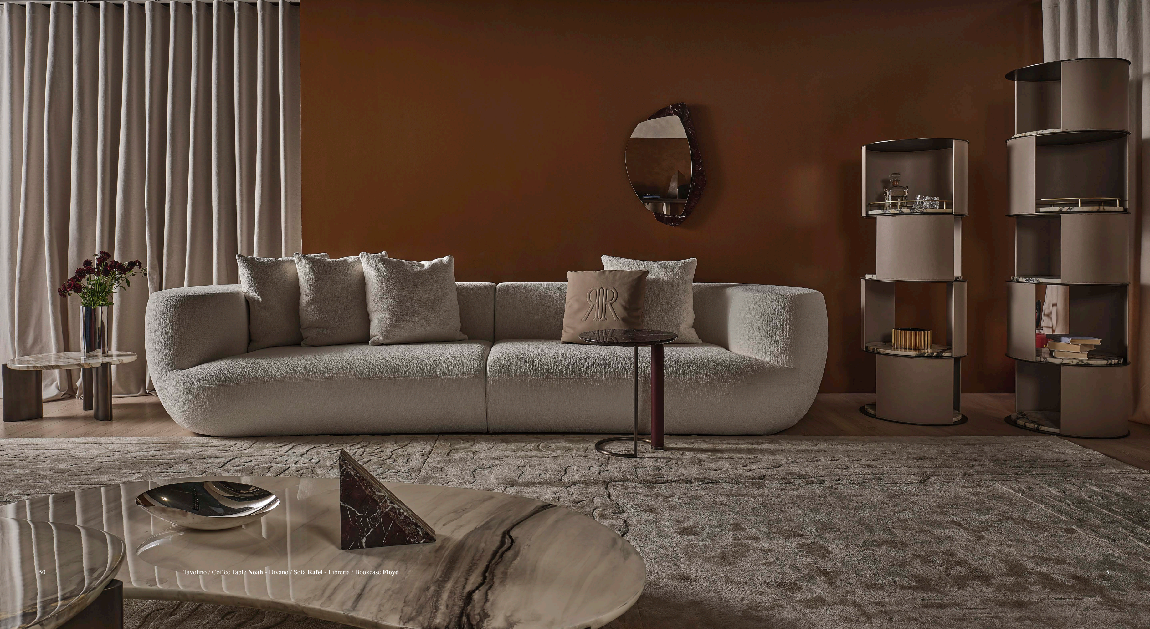
Tavolino / Coffee Table Noah - Divano / Sofa Rafel - Libreria / Bookcase Floyd